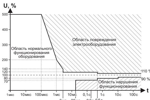
Рис. 1. Кривая работы электрооборудования ITIC (CBEMA), ( http://www.home.agilent.com/upload/cm_upload/All/1.pdf?&cc=UA&lc=eng ).